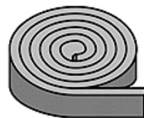
Schnittmöglichkeiten / Cutting options