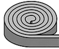
Schnittmöglichkeiten / Cutting options