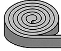
Schnittmöglichkeiten / Cutting options